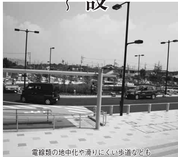
電線類の地中化や滑りにくい歩道なども

中でも、同計画の重点事業の一つである、「梅郷駅周辺のまちづくり」を進めるため、東西連絡自由通路や西口駅前広場の整備などを行ってきました。 また、東口の駅前広場や駅前線なども工事が完了し、10月10日の4時50分に開通します。 東口周辺の整備により、これまで駅の西側に集中していた混雑がなくなり、東西間の行き来や鉄道利用も便利になります。