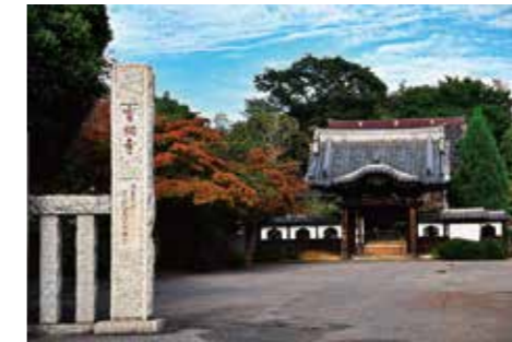
「宰相ここに眠る」 木村 昭