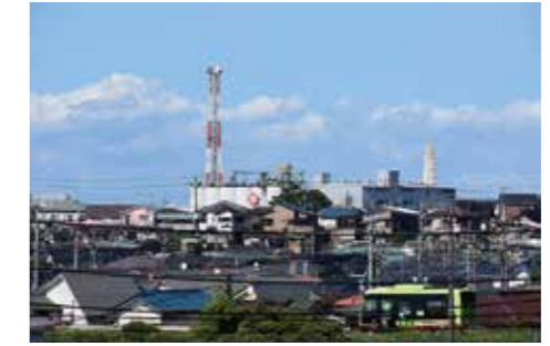
「夏空の街並み」 草間 喜一郎