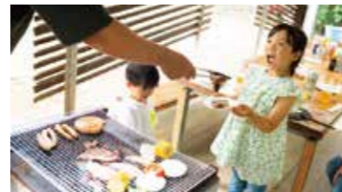
屋根付きでいつでも楽しめる「バーベキュー(要予約)」