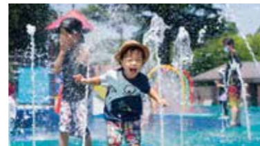
大冒険の1日のはじまり「アクアベンチャー(要予約)」