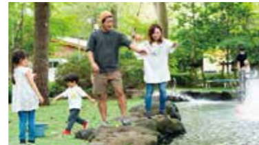
自然感覚の釣り堀「ニジマス釣り」