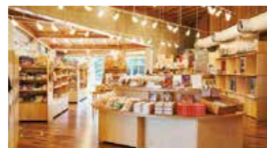
野田市のおみやげが買えるショップ「Ruska」