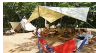
自然に囲まれて宿泊「バンガロー・オートキャンプ場(要予約)」