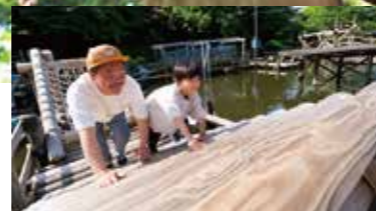
スリルと興奮がいっぱい「フィールドアスレチック(要予約)」