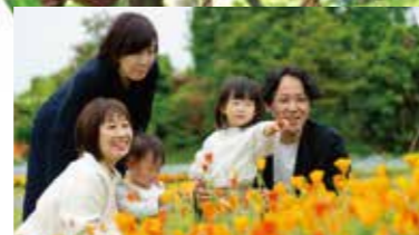
四季の花を満喫「花ファンタジア」

※ご予約なしでもご来場いただけますが、ご予約をおすすめします。 ※ドッグランのご利用には1年以内の「混合ワクチン・狂犬病ワクチン」の証明書の掲示が必要です。