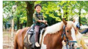
かわいい動物と触れ合う「ポニー牧場」