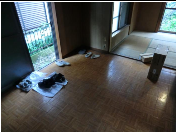
2階 和室 6畳