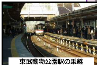
東武動物公園駅の乗継