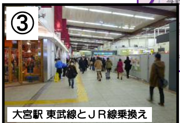
大宮駅 東武線とJR線乗換え