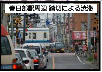
春日部駅周辺 踏切による渋滞