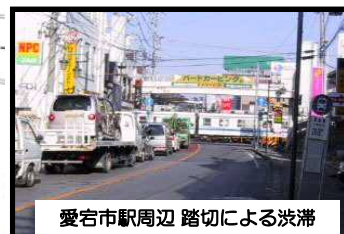
愛宕市駅周辺 踏切による渋滞