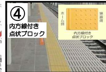
④ 内方線付き 点状ブロック