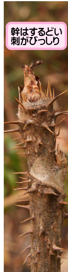
幹はするどい刺がびっしり