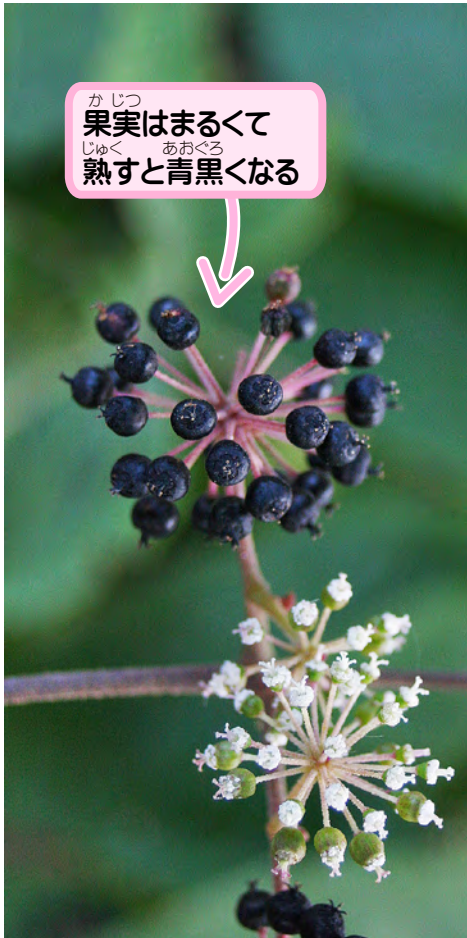
果実はまるくて 熟すと青黒くなる