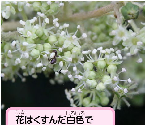
花はくすんだ白色で 虫がたくさんやってくる

春の新芽は「たら芽」と呼ばれて いる。摘んで天ぷらにして食 べるととてもおいしいよ。けど、 あまり芽を摘みすぎるとタラノキが 弱ってしまうからほどほどにね。