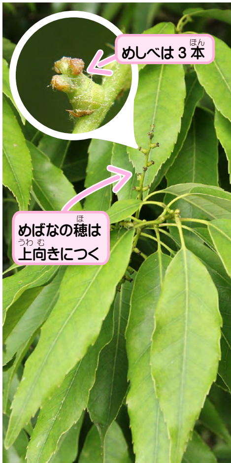
めしべは3本 めばなの穂は 上向きにつく