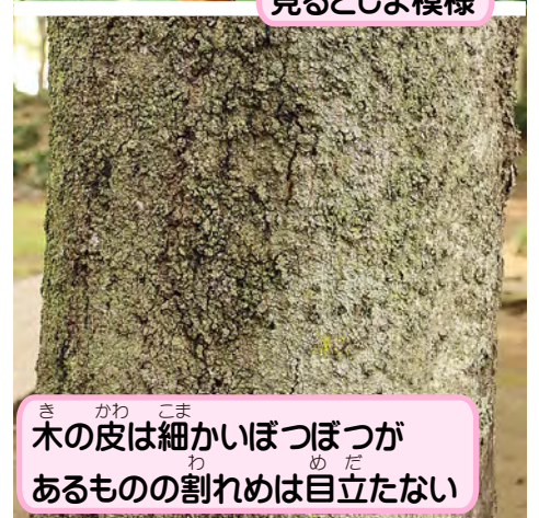
木の皮は細かいぼつぼつが あるものの割れめは目立たない