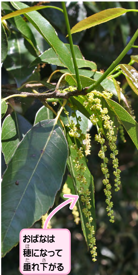
おばなは 穂になって 垂れ下がる

シラカシのどんぐりは細長いかたち でこげ茶色。ぼうしは横から見ると しま模様だよ。ぼうしは種類を 見分けるのに必要だから、いっしょ にひろっておこうね。