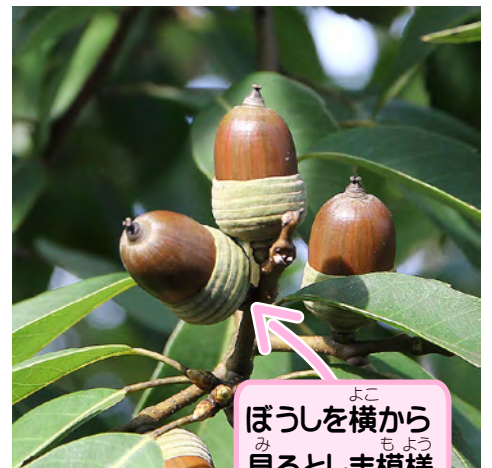
ぼうしを横から 見るとしま模様