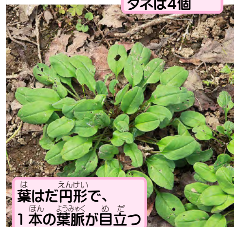
葉はだ円形で、 1本の葉脈が目立つ