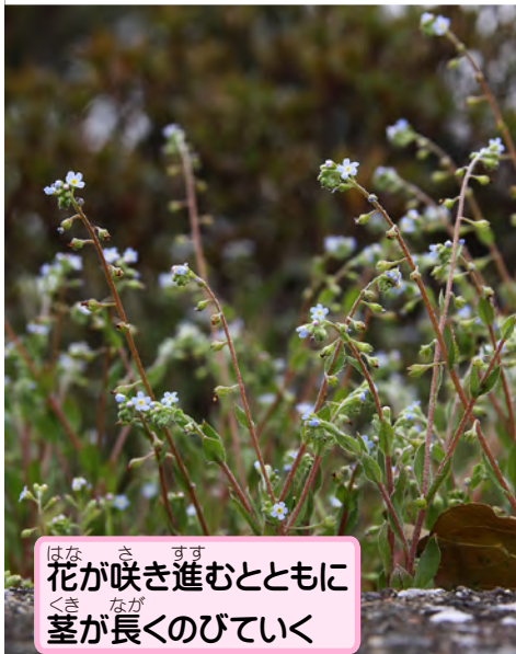
花が咲き進むとともに 茎が長くなるのびていく