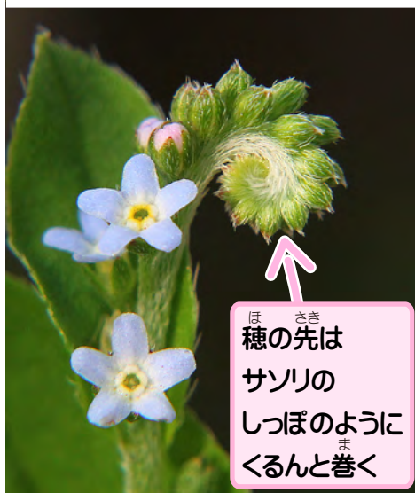
穂の先は サソリの しっぽのように くるんと巻く