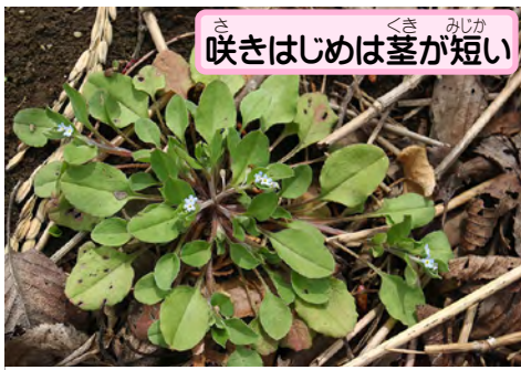
咲きはじめは茎が短い

葉を軽くもんでにおいをかぐと、まるでキュウリのような香り。だからキュウリグサという名前がついたよ。ほのかに感じる程度の香りだけど、見つけたら試してみてね。