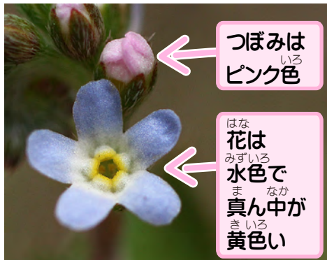
つぼみは ピンク色