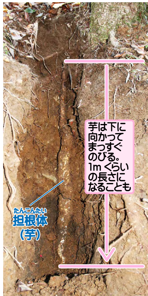
芋は下に 向かって まっすぐ のびる。 1mくらい の長さにも なることも