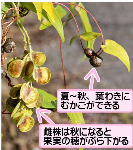
夏~秋、葉わきに むかごができる