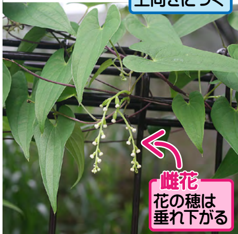
雌花 花の穂は 垂れ下がる