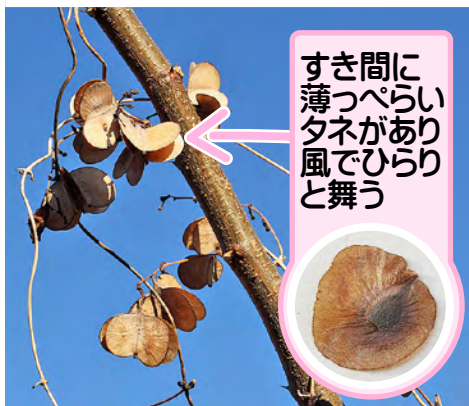
すき間に 薄っぺらい タネがあり 風でひらりと舞う