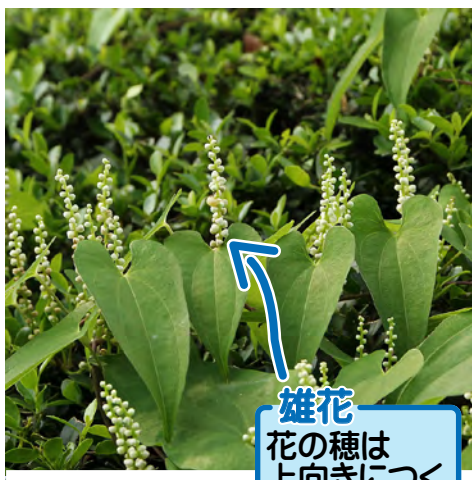
雄花 花の穂は 上向きにつく

ヤマノイモは多年草で、株の充実とともに地中にできる芋もだんだん大きくなります。しかしじつは、1つの芋が何年もかけて少しずつ伸びていくのではなく、毎年春に新しい芋をつくって完全に入れ替わります。新しい芋は、古い芋が蓄えた養分を取り込み、新しく取り入れた養分も蓄えて、前の芋より大きく育ちます。ヤマノイモの芋の部分を担根体(たんこんたい)と呼ぶこともあります。