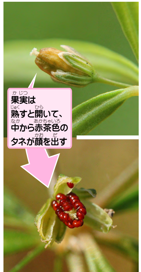
果実は 熟すと開いて、 中から赤茶色の タネが顔を出す