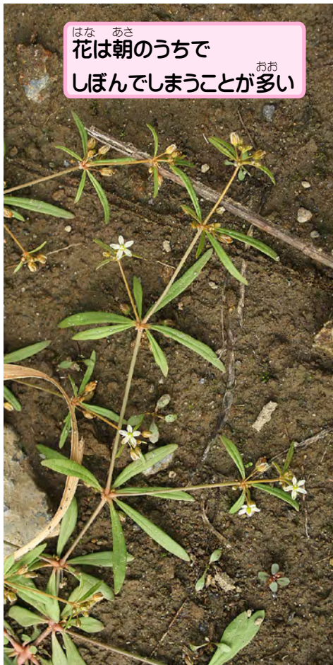
花は朝のうちで しぼんでしまうことが多い

名前にクルマ(車)とついているね。3～5枚くらいの葉が1か所から出て、これがまるで人力車などの車輪の部分のように見えることから来ているんだよ。