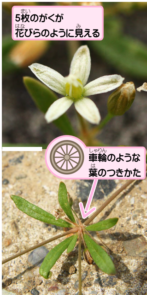
5枚のがくが 花びらのように見える