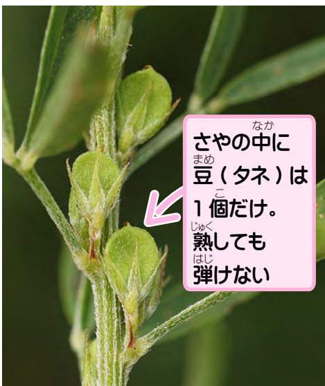
なか さやの中に まめ 豆(タネ)は 1個だけ。 じゆく 熟しても はじ 弾けない