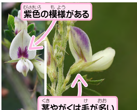
むらさきいろ もよう 紫色の模様がある

きいろ キタキチョウという黄色いチョウの ようちゆう 幼虫は、メドハギなどハギの仲間 が大好き。だから、メドハギがた くさん生える河川敷は、キタキチョ ウもいっぱい飛んでいるよ。