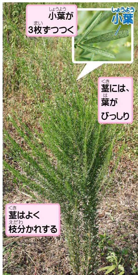
しょうよう 小葉が まい 3枚ずつつく