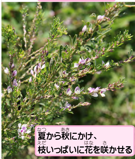
なつ あき 夏から秋にかけて、 えだ はな さ 枝いっぱい花を咲かせる