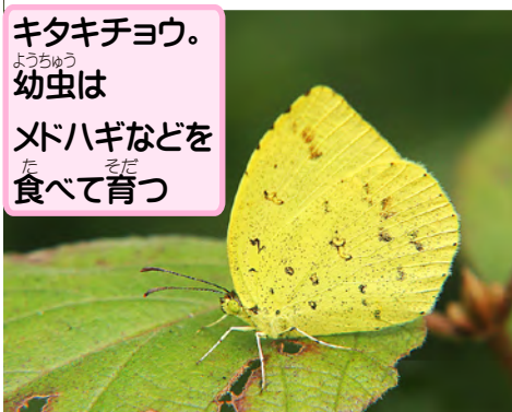
キタキチョウ。 ようちゆう 幼虫は メドハギなどを た 食べて育つ