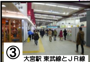
③ 大宮駅 東武線とJR線