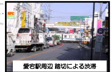
愛宕駅周辺 踏切による渋滞