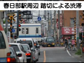
春日部駅周辺 踏切による渋滞

【春日部市】 ◇春日部駅付近連続立体交差事業の早期着工及び中心市街地活性化への支援 ◇東武伊勢崎線一ノ割駅のホームの上屋・防風壁の延長及び拡幅