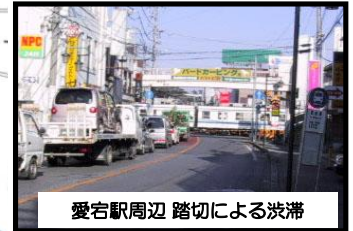
① 連続立体交差事業 L=2.9km (事業中)