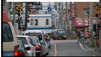
春日部駅周辺 踏切による渋滞

【春日部市】 ◇春日部駅付近連続立体交差事業の早期着工及び中心市街地活性化への支援 ◇東武伊勢崎線一ノ割駅のホームの上屋・防風壁の延長及び拡幅