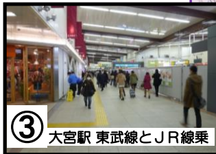
③ 大宮駅 東武線とJR線乗