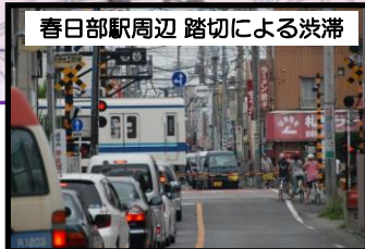
春日部駅周辺 踏切による渋滞

【春日部市】 ◇春日部駅付近連続立体交差事業の早期着工及び中心市街地活性化への支援 ◇東武伊勢崎線一ノ割駅のホームの上屋・防風壁の延長及び拡幅