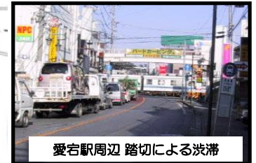
愛宕駅周辺 踏切による渋滞