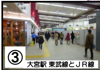
③ 大宮駅 東武線とJR線