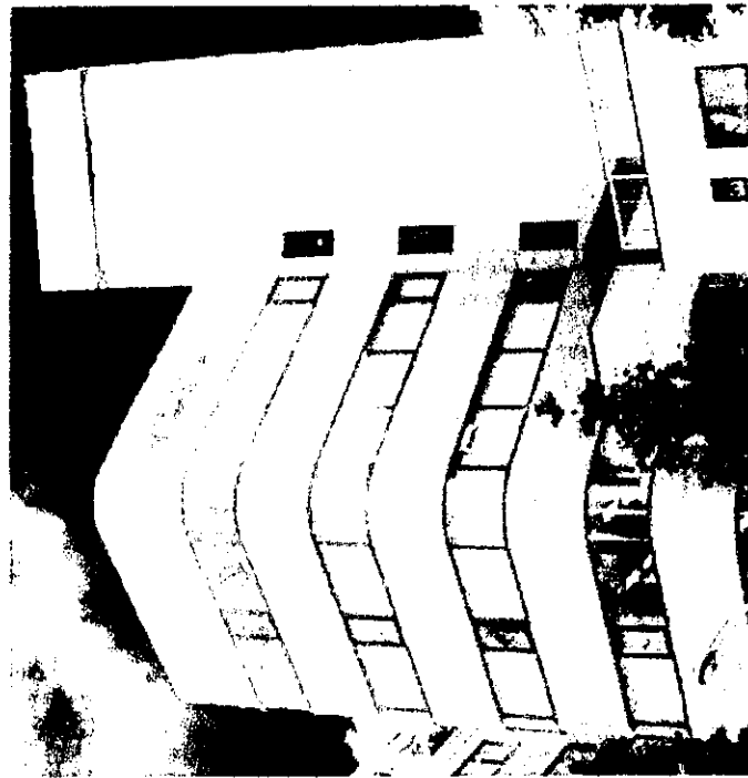
株式会社 LMJ ジャパン

【東会場（東京）】LMJ 東京研修センター（文京区本郷 1-11-14 小倉ビル）