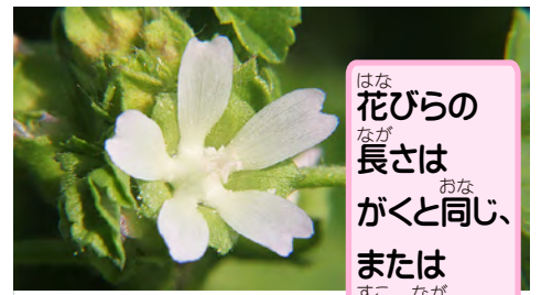
花びらの長さはがくと同じ、または少し長い