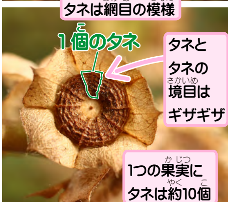
タネは網目の模様