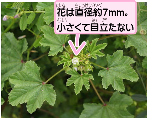
花は直径約7mm。小さくて目立たない

日本の植物学の基礎を築いた、牧野富太郎博士がつけた名前だよ。中国では兔葵と呼ばれていて、そこからつけたんだって。ウサギを漢字で書くと兔だよ。