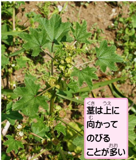
茎は上に向かってのびることが多い