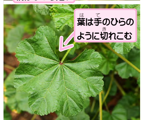
葉は手のひらのように切れこむ