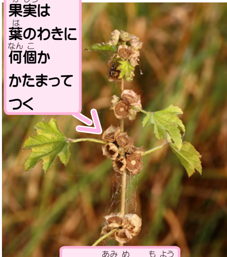
果実は葉のわきに何個かかたまってつく