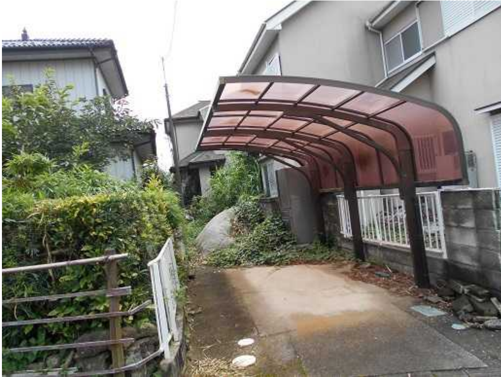
写真 1 : 外観 東から撮影