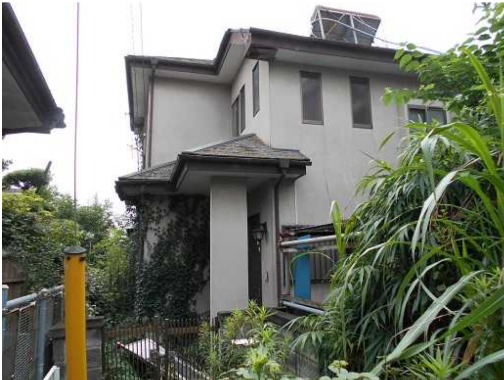
写真 2 : 玄関付近 東から撮影