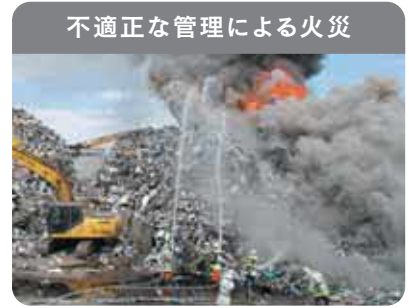
不適正な管理による火災

廃家電は電池やプラスチックを含むため、発火・延焼の危険性があり、不適正な管理による火災が発生しています。