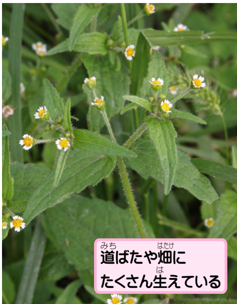
道ばたや畑に たくさん生えている

「掃溜め」は、落ち葉など庭のゴミを掃いて溜めておく場所だよ。最初に発見されたものが、たまたま掃溜めに生えていたために、こんな名前がついてしまったんだ。