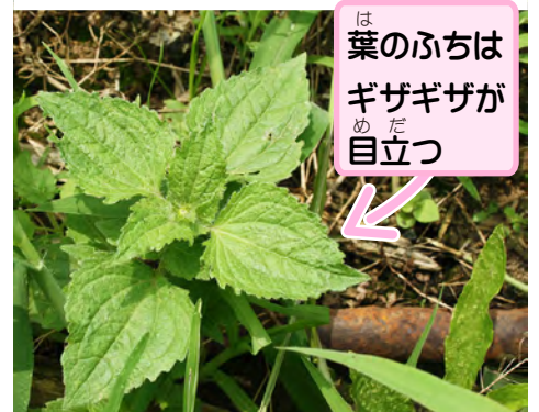
葉のふちは ギザギザが 目立つ