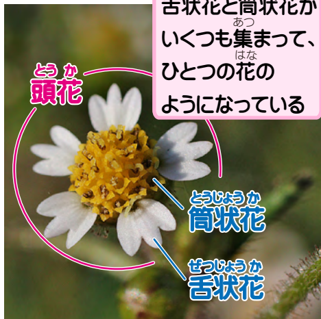
舌状花と筒状花が いくつも集まって、 ひとつの花の ようになっている