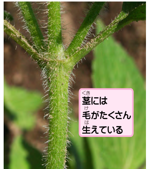
茎には 毛がたくさん 生えている