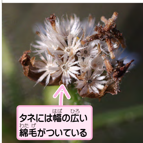
タネには幅の広い 綿毛がついている