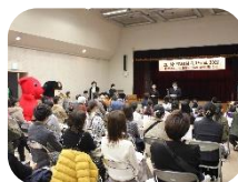
元気アップふえすた

現在登録されている団体は、ボランティア団体やNPO法人、その他広くまちづくりを行う市民団体です。市民(会員)の皆さんが生き生きと活動できるサークルなどもあります。