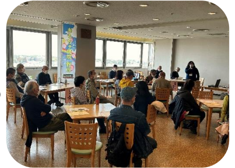
第3回こまめカフェ

市民活動支援センターでは、市民のみなさんに「市民活動」を知ってもらい、活動への参加のきっかけにもらうためのイベント「こまめカフェ」を企画しています。気軽な雰囲気の中で「市民活動って何？」「どんな団体があるの？」という素朴な疑問についてご説明するほか、野田市内で活躍する団体の皆さんにご参加いただき、活動をPRしていただきます。3月3日（日）に開催する「第4回こまめカフェ」の参加団体を募集しますので、ぜひ参加して市民の皆さんに存在をアピールしたり、仲間を募ってみませんか？参加を希望する団体は、市民活動支援センターまでご連絡ください。