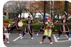
野田エイサー遊び家