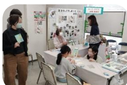
スクラップブックの会