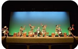
下総之國津久太鼓