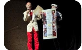
AQUR アキオースゆうせんラジオ