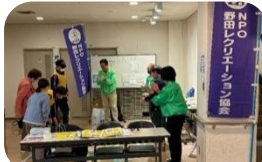
(特非)野田レクリエーション協会