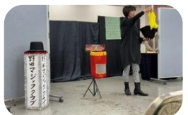
野田マジッククラブ