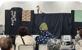
野田文化研究会人形劇みいみ