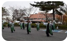
野田よさこい躍り協議会