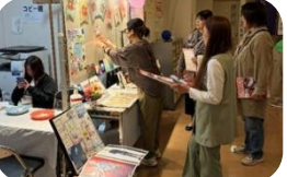
はなのさきっちょ