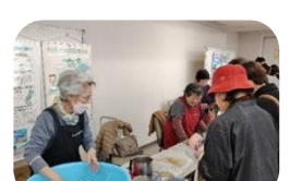
(特非)せっけんの街 野田地区