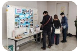
NPO 法人スマイリシェル