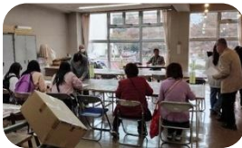
野田もの知り検定企画実行委員会