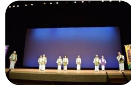
大江戸相撲甚句会