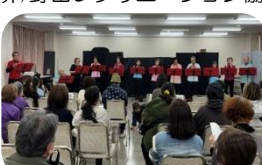
かれんオカリナクラブ