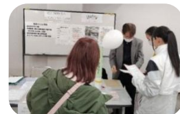
認定 NPO 法人東葛市民後見人の会野田支部