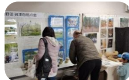
下総野田 谷津自然の会