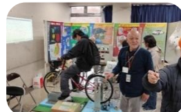
野田エコライフ推進の会