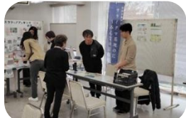
ワライグマ基地のだみんなの居場所