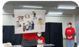
野田市手をつなぐ親の会