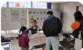
野田市ヘルスサポーターの会