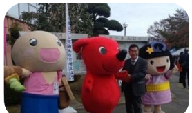
チーバくん・やど助のんちゃん和市長