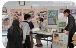
NPO 法人 Earth as Mother 千葉