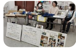
不登校に悩む親の会「テルコの部屋」