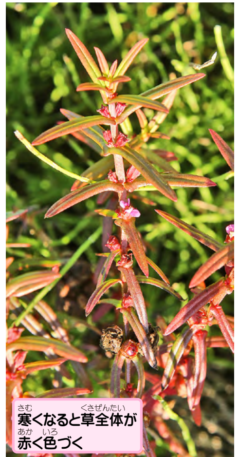
寒くなると草全体が赤く色づく