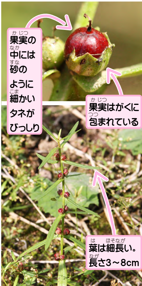
果実の中には砂粒のように細かいタネがびっしり