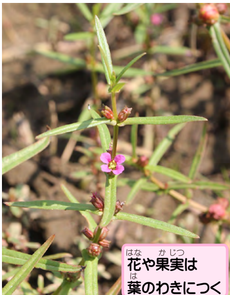
花や果実は葉のわきにつく

ナンゴクヒメミソハギ (Ammannia auriculata) と Ammannia robusta、2つの種類が交雑してパワーアップしたのがホンバヒメミソハギ。今や世界じゅうに広がっているんだ。