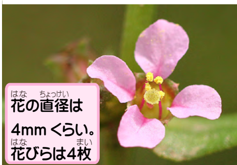
花の直径は4mmくらい。花びらは4枚