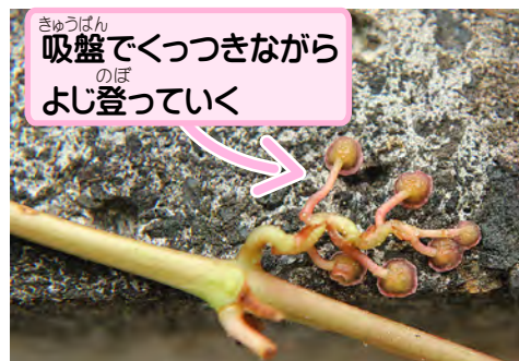
吸盤でくっつきながらよじ登っていく