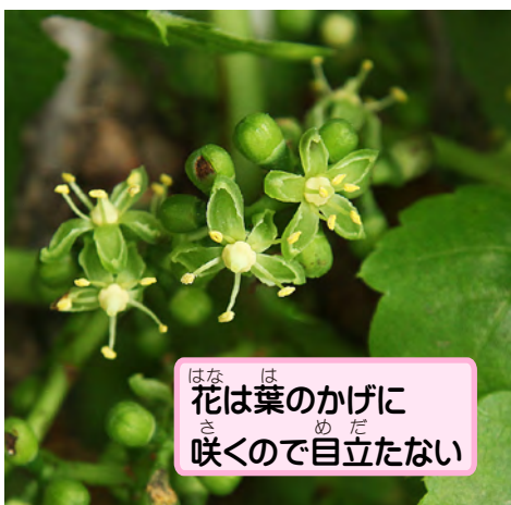
花は葉のかげに咲くので目立たない