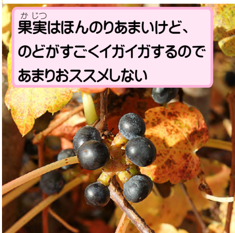
果実はほんのりあまいけど、のどがすごくイガイガするのであまりおススメしない