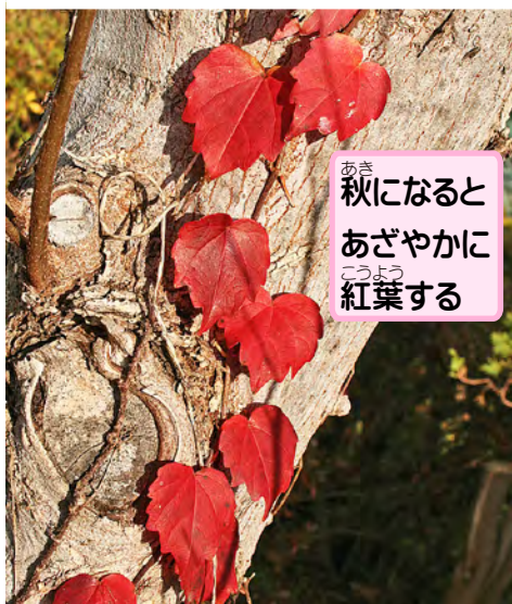
秋になるとあざやかに紅葉する