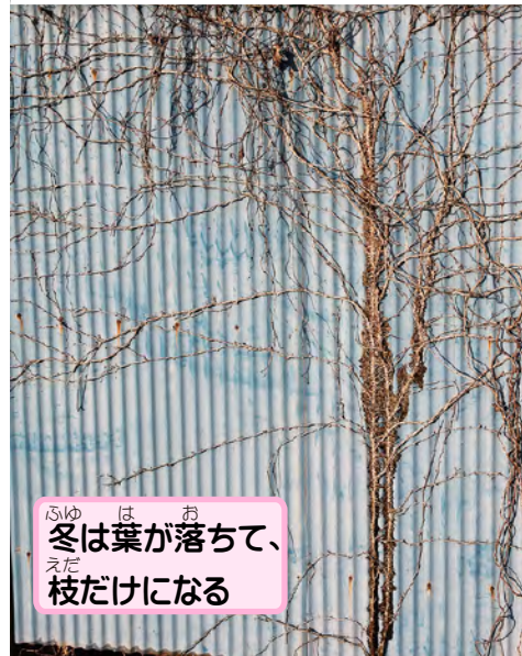
冬は葉が落ちて、枝だけになる