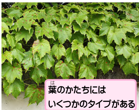
葉のかたちにはいくつかのタイプがある

平安時代、ツタのつるから採れる樹液を煮詰めて、あまい蜜をつくたと言われているよ。そのため昔はアマツラ(甘蔓)とも呼ばれていたんだって。