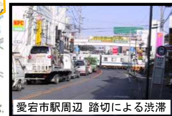
愛宕市駅周辺 踏切による渋滞