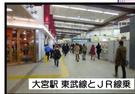
大宮駅 東武線とJR線乗

【杉戸町】 ◇日光街道杉戸宿ほか、沿道にある宿場の魅力向上や観光客を誘致のための、様々なPR活動