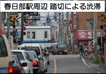
春日部駅周辺 踏切による渋滞

【さいたま市】 ◇大宮駅グランドセントラル ステーション化構想の実現に 向けた連携