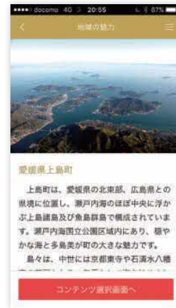
③ 地域のプロフィール