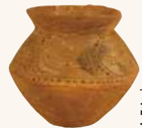
つぼがた 壺形土器