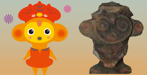
ミミーのモデルになったミミスク形土偶 野田貝塚出土 縄文時代後期～晩期 (野田市教育委員会蔵)