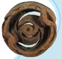
どせいみかざ 土製耳飾り