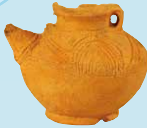
ちゅうこう 注口土器