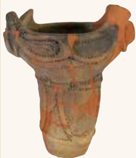
ふかばちがた 深鉢形土器