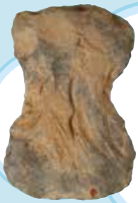
だせいせきふ 打製石斧