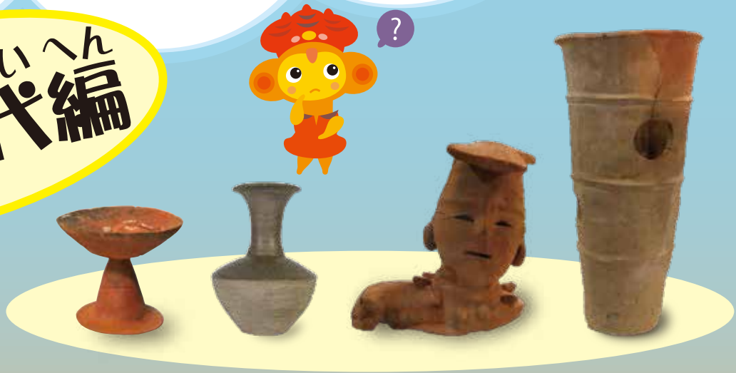
ミミーのモデルになったミミスク形土偶 野田貝塚出土 縄文時代後期～晩期 (野田市教育委員会蔵)