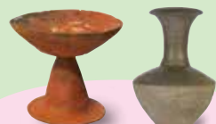
二ツ塚古墳群出土土器