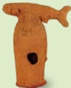
さかながた はにわ 魚形埴輪