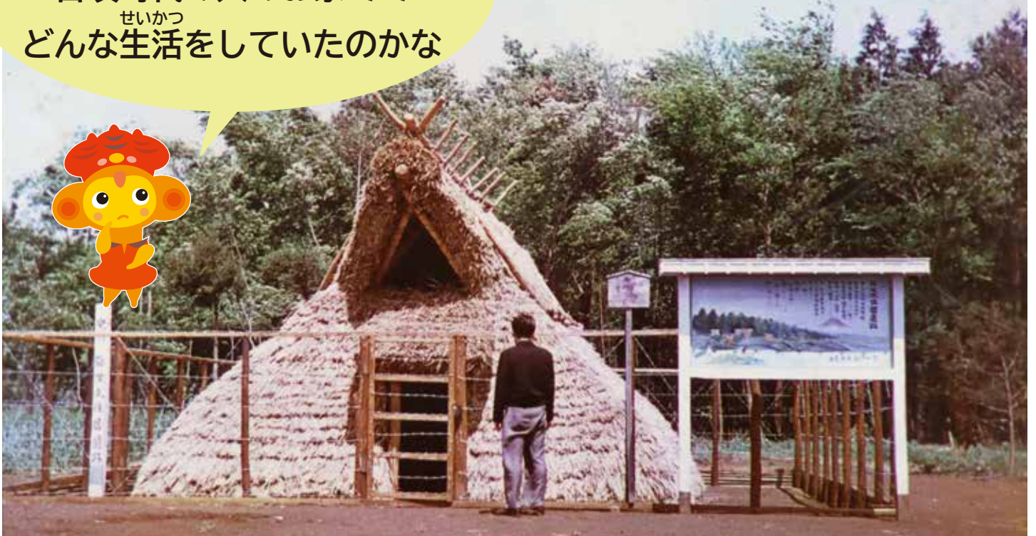
中根八幡前遺跡の復元住居

たてもの へいせい ねん かいたい 建物は平成10年に解体され、 げんざい 現在はありません。