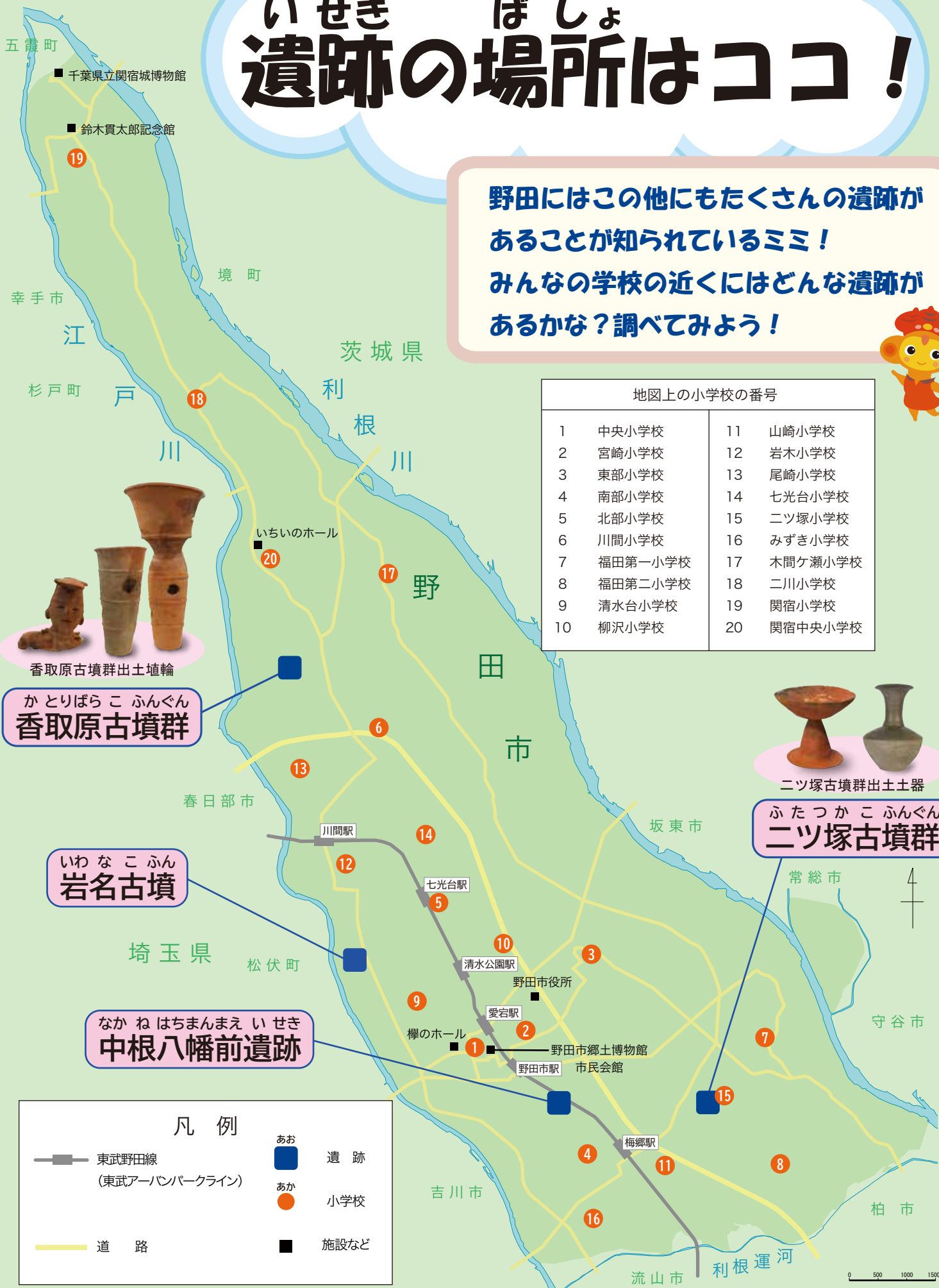
地図上の小学校の番号