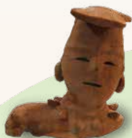
じんぶつ はにわ 人物埴輪

埴輪には、お供え物を置くき だい 器台からへんか た つつがた えんとう 筒形の円筒埴輪や、ぶき も 武器を持ったじんぶつ うま などのどうぶつ いえ 動物、家などをかたどったけいしょう 形象埴輪が あります。これらは、とうじ ひとびと 当時の人々のふくそう 髪 がた みぶん しょくぎょう 型、身分や職業など、しゃかい 社会やそのしく し る手がかりにもなります。