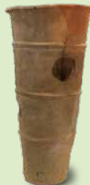
えんとう はにわ 円筒埴輪