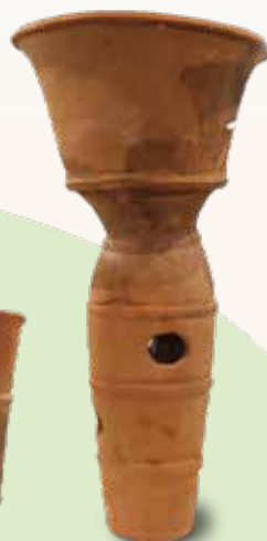
あさがおがた はにわ 朝顔形埴輪