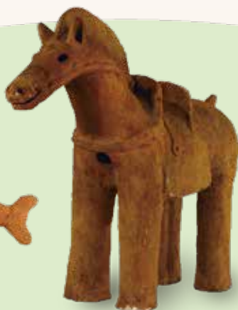
うまがた はにわ 馬形埴輪