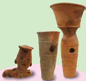
香取原古墳群出土埴輪