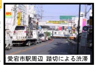
愛宕市駅周辺 踏切による渋滞