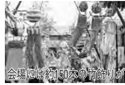
会場には約150本の竹飾りが

8月7日(土)、8日(日)14時～ 21時本町通り周辺(東武野田線 「愛宕駅」下車徒歩約5分)で。 雨天決行。竹飾りコンクールや おどりパレード、野田こいまつ