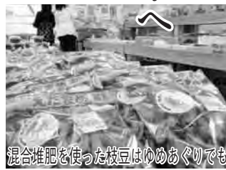
混合堆肥を使った枝豆はゆめあぐりでも

市では、平成12年度から各家庭で処分していた剪定枝や草、落ち葉などを「野田市堆肥センター」で