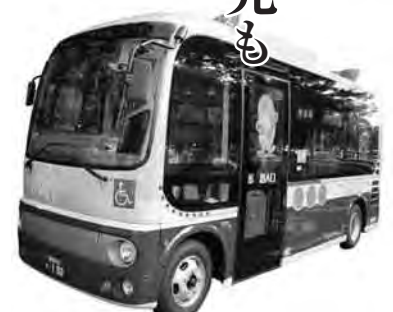
今後も「市民の足」として

なお、7月16日(金)、18日(日)、31日(木)、8月7日(土)、8日(日)は、「三ヶ町夏祭り」と「野田みこしパレード」、「野田夏まつり躍り