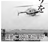
黒酢には殺菌効果が