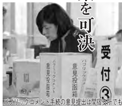
パブリックコメント手続の意見提出は関係支所でも