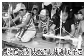
博物館では「火おこし体験」も予定

往復はがき(1枚で親子1組か2人まで)に、参加者全員の住所、氏名、年齢、電話番号、集合場所、市報に関する意見を明記し、〒278-18550野田市役所秘書広報課「親子公共施設等見学会」係へ