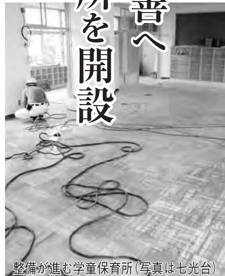
整備が進む学童保育所(写真は七光台)

市では当初、過密化の解消が必要な既存の学童保育所を分割し、施設運営を民間に委託する方向で検討しましたが、民間委託に対し一部反対の声があったことから、分割後の施設運営を実績のある社会福祉協議会に委託する方針を示したも