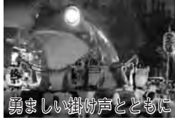
勇ましい掛け声とともに

7月31日(日)15時～22時本町通り周辺 (東武野田線「愛宕駅」下車徒 歩約5分)で。雨天決行。15時 30分からは子どもみこしが、17 時20分からは市内各地域の11基 のみこしが練り 歩く。圃同実行 委員会(野田商 工会議所内) ☎ 7122-135 85