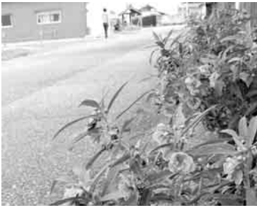
地域が協力してきれいな区域に