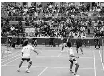
地元開催は若潮国体以来37年ぶり

全国から11チーム44人の監督・選手が集結し、一点を競う緊迫した試合展開に、会場は大興奮に包まれた。地元千葉代表は成年男子が優勝、少年女子が4位という好成績を収めた。