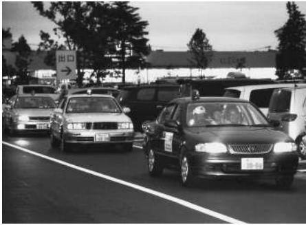
青色回転灯搭載車でパトロール(17年7月撮影)

わたしたち野田市民は、日本国憲法、地方自治法の基本理念に則り、地域の個性を生かしながら、基本的人権を尊重し、平和を尊ぶ野田らしいまちづくりに懸命に努力を続けている。 日本国憲法、地方自治法施行50周年の節目の年にあたり、わたしたちは、両法の重要性を再認識するとともに、市民憲章の精神、平和祈念碑の碑文の精神を育みつつ、豊かな自然と歴史を生かした健康な文化都市を目指すために、ここに野田市を「個性豊かなまちづくりを行う人権・平和尊重都市」とすることを宣言する。 (平成9年5月5日)