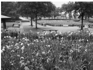
園内にはベンチも設置(昨年撮影)

入れを行い、約50種2万株のシヨウブが植えられている。例年6月下旬ごろまで、一面に紫色の花を咲かせ、家族連れやカメラマンなど、訪れる人の目を楽しませてくれる。