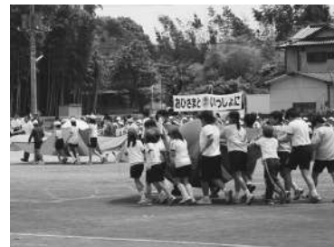
みんなで力を合わせて

ほか、樽太鼓の演奏や柳沢小・第一中の児童生徒によるプラスバンドなどのアトラクションも行われ、最後は参加者全員で「手のひらを太陽に」を、手話コーラス付きで歌った。