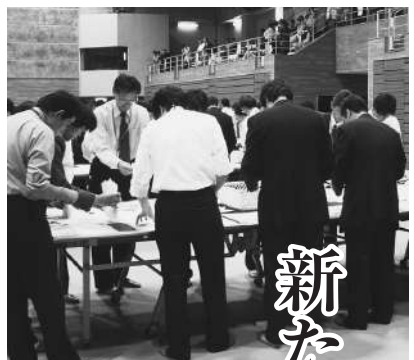
合併後初となった「市議会議員選挙」の投票が、5月28日7時から20時まで、市内45か所の投票所で行われました。

21時15分からは、総合公園体育館で即日開票され、32人の市議会議員が選出されました（4面・5面に新市議会議員を紹介）。