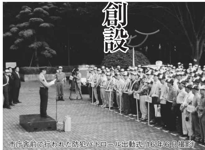
市庁舎前で行われた防犯パトロール出動式(16年6月撮影)

さらに、単一自治会のエリアを越えた防犯パトロールのコース設定や個別の自主防犯組織で行うより効率的な防犯活動、青色回転灯搭載の防犯パトロール車の活用など、個別の自主防犯組織では実施が困難な防犯活動も出来るよう