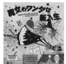
「魔女のワンダは新入生」 マーク・スプリング・作 小峰書店

はじめて学校に行く日、ワンダは、ちよっぴりまよってました。ママと家ですごしたほうがいいかな、楽しく学校にいつて、友だちつくるのもいいなあ。学校につくとなにかがちがうのです。