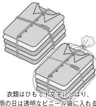
衣類はひもで十文字にしぼり、雨の日は透明なビニール袋に入れる