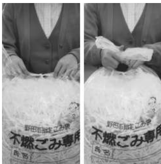
ベロと取っ手を縛って

集積所に出すときは、まず最初にベロを縛ります。さらに、取っ手自体を縛って、袋の中身が出ないようにしてください。取っ手部分を縛らないと、そこからごみが飛び出して集積所を汚してしまうこともあります。テープやひもなどで袋の口を止めることはルール違反になります。