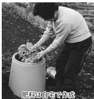
肥料は自宅で作成