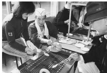
「はしを寝かせて均等に焼くのがコツ」と指導してくれた特製「野田づくし弁当」を堪能。キッチンコマンもの知りしようゆ館では、野田名店の指導でせんべいの手焼きも体験し、焼きたての香ばしい醤油せんべいを口いっぱいにはおぼっていた。

高齢者とベーゴマやお手玉などを楽しむ「くすの木交流会」や、約400坪の畑での地元農家の協力による野菜作りに加え、「サマーキャンプ」では6年生が地域の方の家に宿泊もします。今では、児童は毎朝「グッドモーニング」と地域の方とあいさつを交わしながら登校しています。