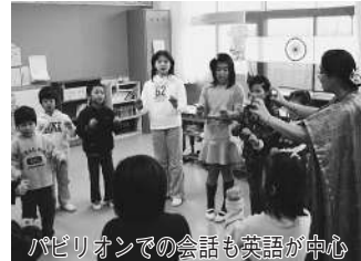
パビリオンでの会話も英語が中心 しみながら各国の文化に触れ合いました。また、地域との交流も盛んで、全校児童が

その後、近隣の宅地開発が進み、18年度からは特認校の指定も外れ、今では180人の児童が通っています。 同校では、平成14年から、少人数学級の利点を生かして本格的に英語活動に取り組み、日常会話をはじめ、英語の歌や劇に挑戦したり、17年度からは「北小万博」を開催し、外国文化にも親しんでいます。 万博では、教室や近くの公民館を各国のパビリオンに見立てて装飾し、地域に住む外国の方などが館長となり、昨年は9か国14パビリオンで歌やゲーム、衣装などを通じ、楽