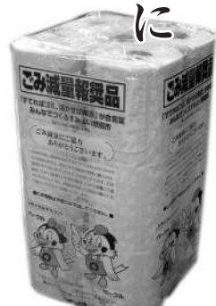
古紙100パーセントの再生品