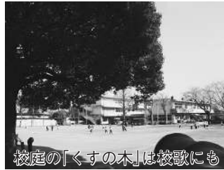
校庭の「くすの木」は校歌にも ピーク時の昭和54(1979)年には千200人以上いた児童も、平成14年には43人となり、小規模特認校となりましたが、そ

北部小学校は、明治6(1873)年6月に開設した吉春小学校と岩名小学校に始まり、明治22(1889)年に両校を統合し、七福尋常小学校として現在の場所に開校しました。