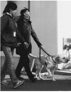
盲導犬の正しい理解を

南コミュニティ会館で。「フランダースの犬」を上映。おむね3歳以上。無料。当日会場受付。敷物、靴袋を持参。同うめさと子ども館 ☎712419106 ◆野田市探検 3月25日(日)9時30分 関宿子ども館集合、15時30分解散。まめバスで清水公園へ行き散策。小学生。先着15人。参加費100円(交通費)。昼食、飲料水を持参。事前に参加費持参で関宿子ども館 ☎719813456へ ◆盲導犬体験フェア in 野田 3月25日(日)10時～15時 市役所1階ロビーと8階大会議室で。盲導犬との体験歩行や盲導犬を使用する方へのガイドの仕方など。目の不自由な方先着20人、一般の方先着180人。3月15日(日)までに電話か直接社会福祉課へ。同盲導犬を普及させる会 ☎901800317790