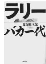
「ラリーバカー代」 篠塚建次郎・著 日経BP社

◆戦争かたりべの会 3月9日(日)13時30分~16時総合福祉会館で。戦争体験者3人の話を聞く。先着50人。無料。当日会場受付。闘争体験者の会・日佐戸 ☎7122-11418 ◆永彩会作品展 3月10日(日)~15日(因)9時~19時(初日は正午から、最終日は15時まで)市役所1階ふれあいギャラリーで。水彩画30点。岡相座 ☎7127-0651 ◆野田春のいけばな展 3月10日(日)9時~18時、11日(日)9時~17時野田公民館ギャラリー(櫻のホール内)で。25点。岡野田いけばな協会・杉本 ☎7124-8773 ◆史跡探訪 3月17日(日)9時50分JR品川駅中央改札口外の時計台集合、15時解散。旧東海道品川宿