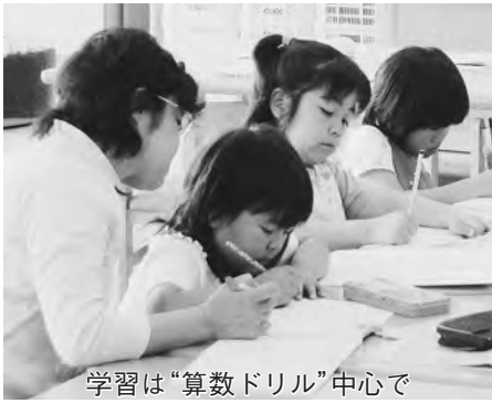
学習は「算数ドリル」中心で

市では、ごみの減量とリサイクルの推進のために、10月13日(土)と14日(日)に開催する「野田市リサイクルフェア」で、今年も「古本市」を開催します。