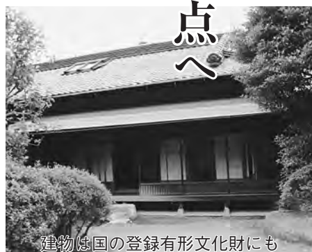
建物も国の登録有形文化財にも

また、来館者が自由に学べる場所として、学芸員の事務スペースの隣には、全国の博物館との交流により得られた展示品の図録や研究成果など、市の図書館でも所蔵