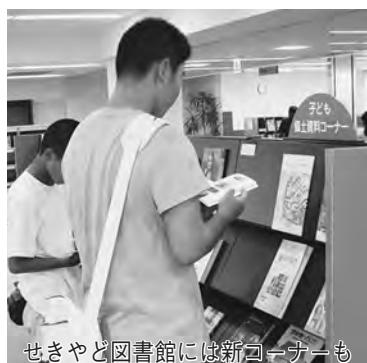
せきやど図書館には新コーナーも

集業務の民間委託(83万円減)、東部小学校の給食調理業務の民間委託(2千422万円減)、学校用務員業務の民間委託(731万円減)、未利用