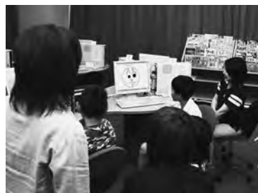
小学4・5年生の親子9人が参加

ように動きだすと、思わず子どもたちから歓声も。さらに、「海の中を散歩する自分」や「海老で鯛を釣る自分」など、独自のアニメを次々と作ると一緒に参加した親もその創造力に感心していた。