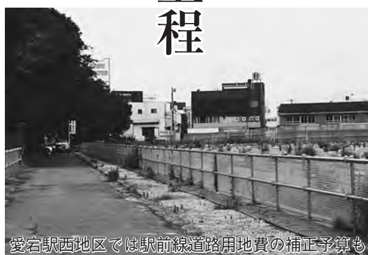
愛宕駅西地区では駅前線道路用地費の補正予算も

◆議案第5号 野田市都市計画法に基づく開発行為等の許可の基準に関する条例の一部を改正する条例の制定 都市計画法の改正に伴い、条例で引用している条番号の変更及び市街化調整区域における