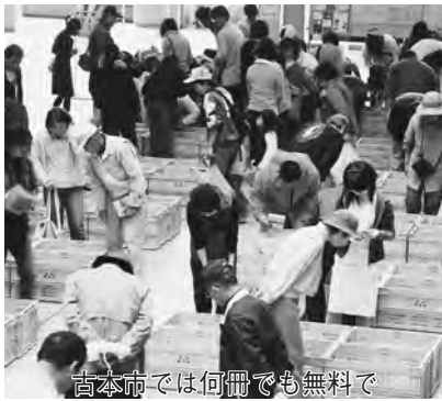
古本市では何冊でも無料で

月2日(日)に自宅まで取りに伺いますので、それぞれの回収日の前日までに、清掃計画課へご連絡ください。