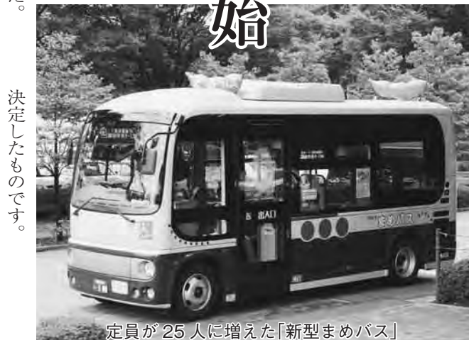
定員が25人に増えた「新型まめバス」

上回ったことから、運行経費の限度額を年間6千800万円に増額する案を作成し、昨年11月21日に開催したコミュニティバス検討委員会の賛同を得て、決定しました。