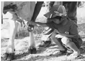
牛の大きさに恐る恐る触る子も

会場では、地域の方手づくりの竹馬に親子で挑戦したり、ベーゴマでは親の方が熱中する一幕も。また、牛の乳搾り、グラウンド・ゴルフ、日が暮れてから、盆踊りも楽しんでいた。