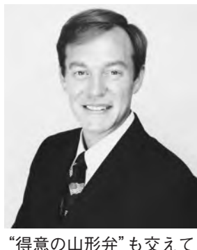
“得意の山形弁”も交えて