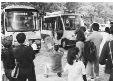
賑わう撮影会は順番待ちも

定員が25人に増えた「新型まめバス」も会場に登場。訪れた親子連れは、運転席に座ってポーズをとったり、バスのキャラクターと並んでの記念撮影を楽しんでいた。