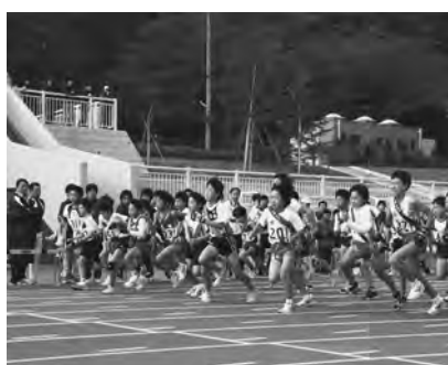
昨年は105チームが参加

クリング周回コースを使用 【種目】小学男子の部、小学女子の部 Ⅱ7キロメートル/中学女子の部、一般・高校女子の部 Ⅱ9キロメートル/中学男子の部、高校男子の部、一般男子の部 Ⅱ15キロメートル