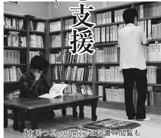
「市民つどいの間」では図書の閲覧も