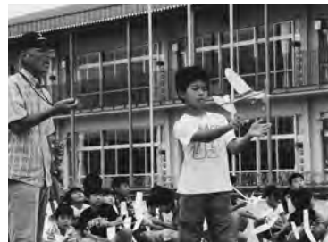
記録目指して慎重に“離陸”

自でゴム動力の模型づくりにも挑戦。完成後は校庭で、滞空時間計測会も行われ、ライト兄弟が人類初の動力飛行に成功した際の記録12秒を目指し、模型飛行機飛ばしに熱中した。