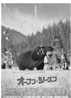
熊のブーグが大活躍