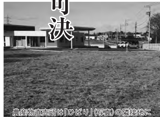
農産物直売所は「ひばり」(写真)の隣接地に