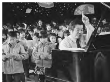
児童とバンドが一体に

Band」の演奏をひと足早くプレゼント。始めは、プロの生演奏に圧倒されていた児童らも、最後には全員で「赤鼻のトナカイ」などを元気に合唱し、ジャズの魅力を楽しんでいた。