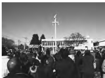
県の無形民俗文化財にも指定されている「つく舞」

お囃子や獅子舞など、地域に伝わる民俗芸能を次世代にも伝えていこうと、12月9日、文化会館と同駐車場「民俗芸能のつどい」が今年も開催され、保存会や小中学校の郷土芸能クラブなど12団体が参加した。10周年の今回は、20年以上続く雨乞いの民俗行事「つく舞」を35年ぶりに日中に披露。10メートルを越える柱上では、倒立や弓で矢を射るなどの妙技が繰り広げられた。