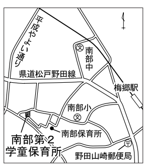
南部第2学童保育所の位置図

◆入札参加資格審査申請の手続きはお早めに 平成20年度に発注する、建設工事や業務委託の請負、