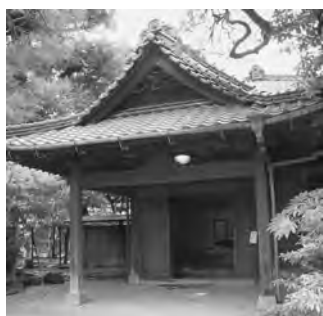
大正末期に醤油醸造家邸宅として完成