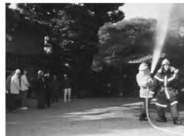
市民会館玄関に向け放水も

また、「だれでも火災の時は慌ててしまつので、日ごろから消火器の設置場所を覚えておくことが大切」と消防職員の指導を受け、通報訓練や初期消火訓練にも真剣な表情で取り組んでいた。