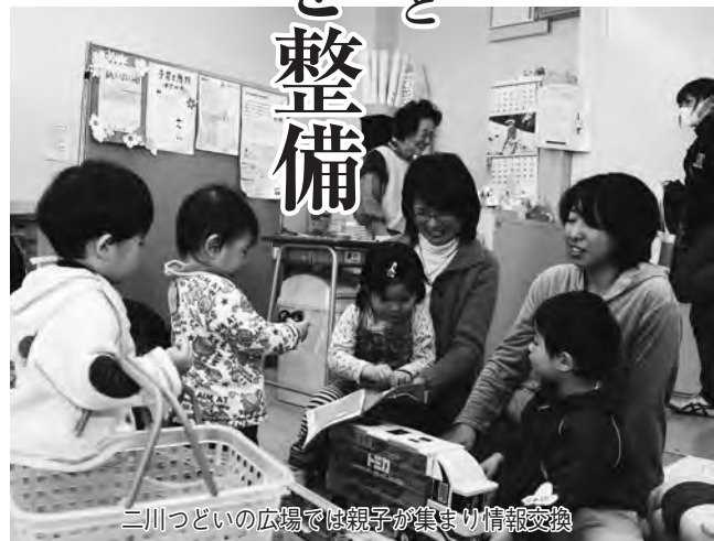
二川つどいの広場では親子が集まり情報交換