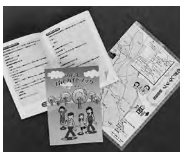
子育て情報がカラーで見やすく

平成18年4月には、市の子育てに関するさまざまな情報を掲載している「のだし子育てガイドブック」の改訂版を作成しました。 改訂版は、編集を子育て支援