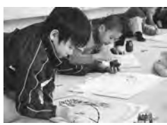
も作画に使った割りばし 年生の図画の授業風景が紹介される予定。 【問合せ】 指導課

除料は、「均等割額」の3万7千400円と、総所得金額から33万円の基礎控除額を引いた金額に7・12パーセントを乗じた「所得割額」の合計額です（上限は50万円、100円未満は切り捨て）。