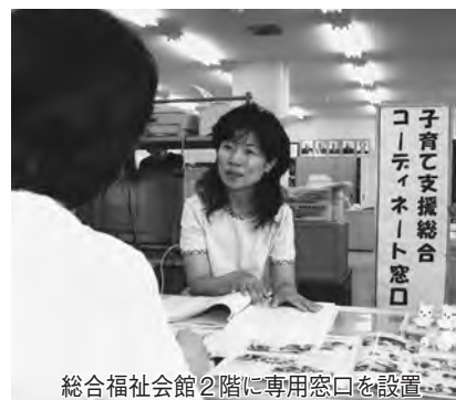
総合福祉会館2階に専用窓口を設置

階／相談専用電話・ファックスは ☎・☎ 712515115 ／相談専用電子メールは nodakosodate@image.ocn.ne.jp / ホームページは http://www.nodakosodate.soudan-center.com ◆ 病児・病後児保育 ：ひばりルーム(小張総合病院内) ☎ 712416847