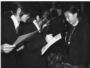
ゲーム中サイン交換する場面も

当日は、お互いの学校生活の紹介や合唱を披露しあったほか、意見交換の場では、旅行中で唯一、日本の中学生と触れ合える機会とあって、上海の生徒からは、授業の内容や休日の過ごし方など、多くの質問が寄せられていた。