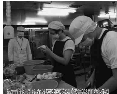
障害者のさらなる雇用拡大に(写真は市内病院)

また、昨年4月からは、「野田市障害者総合相談・就労支援センター」を設置し、市独自の雇用情報の提供や就労の支援なども行っています。しかし、障害者が就労するにあたり、事業主と雇用条件が合わない場合があることや、職場への適性や能力を見極める必要があることから、職場実習とは別に、短期間の試行雇用が必要と考えました。