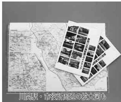
川間駅・市役所周辺の拡大図も

3月の発生件数:12件 20年累計(31件) 建物火災5件(13件) 林野火災0件(0件) 車両火災0件(1件) その他7件(17件)