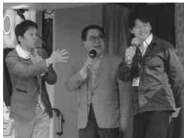
「夢は大きく」とメッセージも

披露した。また、番組終了後、後輩たちを前に質問にも快く応じ、「笑いを取るには『間』が大切」、「うまく話すにはひたすら練習」など、落語の秘訣も