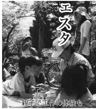
親子で工作の体験も