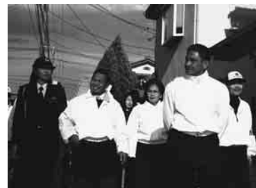
そろいのジャンパーを着てパトロール

受けた後、実際に近くの中央東支部を訪れ、防犯パトロールに同行、住宅街を1時間程歩いた。また、「まめばん」も見学するなど、地域ぐるみの防犯活動に関心を寄せていた。