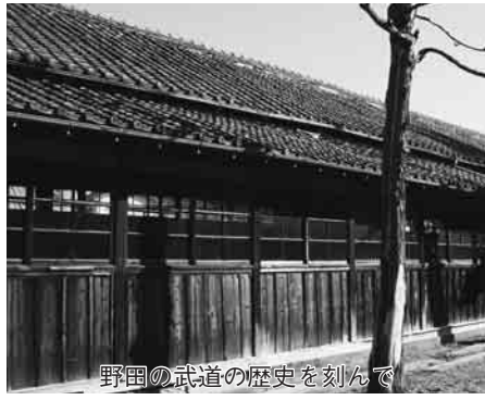
野田の武道の歴史を刻んで

「春風館道場」は、昭和3（1928）年に現在地（野田376番1）に開館して以来、80年間にわたって、柔剣道愛好家の交流の拠点として貢献してきた「醤油の街・野田」のシンボルの建築物のひとつです。