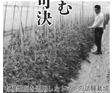
有機堆肥を活用したトマトの試験栽培

第1回定例市議会は、2月29日から開催され、有機堆肥を活用した農産物のブランド化や中心市街地活性化基本計画策定などを含む新年度予算案など36議案を可決し、3月25日に閉会しました。