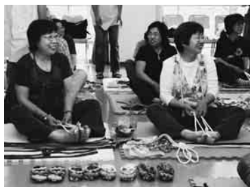
着れなくなった洋服も思い出に

人を対象に「布ぞうり講習会」を開催した。手足を器用に使い、好きな色布を約2時間編むと、オリジナルぞうりが完成。「不用になった布でも作れるし、洗濯できるのも良い」と満足していた。