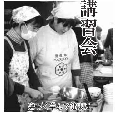
楽しく学んで健康に

嘱を受け、健康づくりの支援活動を行っている、食生活改善推進員による料理講習会が、市内各地区で、開催されています。