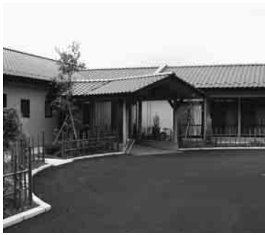
全室個室の「ヴィラ・ほまれの家」

特別養護老人ホーム「ヴィラ・ほまれの家」と、小規模多機能型居宅介護事業所「きららほーむ」の2事業所を指定し、ともに8月1日にオープンする予定です。定員20人のユニット型の、小規模特別養護老人ホーム「ヴィラ・ほまれの家」(目吹2011-3)は、全室個室で10人を一つのグル