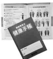
「えだまめ体操」の紹介も中央の各出張所です。