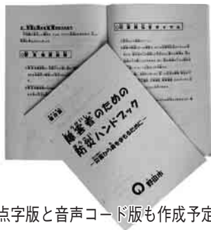
点字版と音声コード版も作成予定

ハンドブックでは、「目の不自由な方は、白杖などを身近に置く」、「耳の不自由な方は、補聴器の電池、筆談用の筆記用具を準備しておく」など、障害種別ごとに日ごろから備えておくべき点や、災害時の行動の注意点をわかりやすくまとめています。