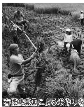
有機減農薬による米作りを