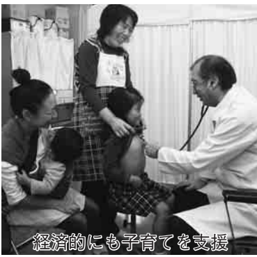
経済的にも子育てを支援

また、市民一人ひとりの健康に対する意識の向上を目的に策定した「野田市健康づくり推進計画21」に基づき「乳幼児医療費助成」の拡充や、「24時間小児救