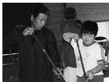
慣れない棒の扱いに苦戦しながらも

が同校で、下根獅子舞のうち笛の演奏と棒剣術を行った。同獅子舞と棒剣術は毎年11月、作物の収穫を祝う木間ヶ瀬の民俗芸能。棒剣術では、1つの型を見事に習得していた。