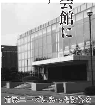
市民ニーズにあった改修を