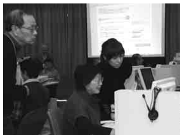
税務署職員をサポートも

参加者25人の中には、初めて確定申告書を作成する主婦もいて、慣れない操作方法に戸惑いながらも、メモを取りながら熱心に画面に向かっていた。