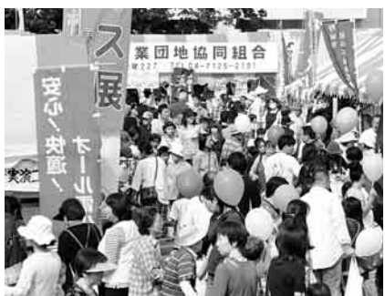
昨年は約43,000人の人が出た

【申込みと問合せ】野田商工会議所(櫻のホール内)で配布する申込書に出展料を添えて、野田市産業祭運営委員会(同会議所内) ☎7122-3585へ