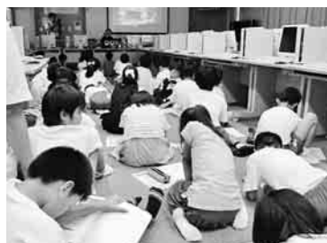
4年生93人が節電を学習

家庭にある電化製品の消費電力やすぐできる節電の取り組みに、児童らは真剣に耳を傾けていた。「家でもできるだけエアコンを使わず、扇風機で頑張りたい」と話す児童もいた。