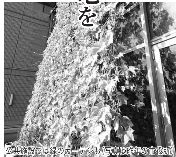
公共施設では緑のカーテンも(写真は今年の市役所)

電対策に加え、原則として、施設の空調設定温度を従来の28度から30度へ引き上げることや、蛍光灯の抜き取りや消灯による照明の25パーセント削減、清掃工場と閑宿クリーンセンター焼却炉の平日1炉休止、水道施設での送水ポンプの圧力調整、待機電力の徹底した削減など、各施設の状態に応じた節電対策の実施を決定し、目標の達成に向けて節電に取り組んでいます。