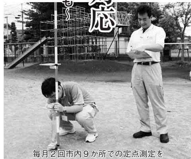
毎月2回市内9か所での定点測定を

測定結果を見ると、文部科学省が示した校舎、校庭などを利用する判断基準となる放射線量の暫定値である年間1から20ミリシーベルトの最大値20ミリシーベルトを時間換算した1時間当たりの放射線量3・8マイクロシーベルトを全ての地点で下回る状況でした。しかし、この数値が高すぎるなどの批判があったことから、同省は福島県内の関係機関に、今年度の学校において児童生徒な