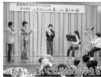
ふれあいの集いには地域の小学生も 確認を行う「友愛訪問」のほか、21年度からは知識を広げるとともに会員同士の交流を深め

東部地区では、平成11年4月に「地域ぐるみ福祉ネットワーク」を発足し、12年2月には、少子高齢化や地域でのつながりの希薄化などの問題に地域全体で対応していくようと、「東部地区社会福祉協議会」を設立しました。 「ふれあい」の心を大切に 同地区は、目吹、鶴奉、横内、大殿井、宮崎と柳沢の一部の計19自治会、約2千世帯からなり、「ふれあいの心が育てる福祉の輪」をテーマに、子どもから高