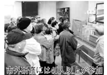
市外研修には40人以上が参加 ようと、新たに市外研修も開始しました。さらには、地区内のおいそら運動や体育協

齢者までが地域に溶け込み、快適な暮らしができることを目標に掲げて活動しています。 同社協では、6つの地区ごとに、高齢者を招待し親睦と交流を深める「ふれあいの集い」や、高齢者世帯を訪問し相談や安否