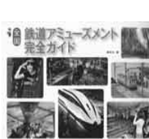
「全国鉄道アミューズメント完全ガイド」講談社

懐かしい風景のジオラマや鉄道模型、保存された鉄道車両の数々には、鉄道ファンならずとも心が躍ります。眺めて楽しむのもよし、旅やお出かけのプランづくりの参考にしてもいいでしょう。