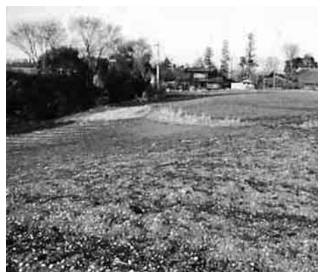
発掘調査では竪穴式の住居跡や縄文人骨の発見も