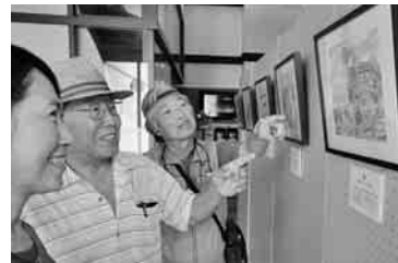
作者(右)による作品の解説も

県内各地の河川や海などの水辺風景を水彩技法で描いた水彩画展は、平成14年から毎年開催され、今年で10年目を迎えた。来場者は「優しい色合いの絵で心が癒されます」と話していた。