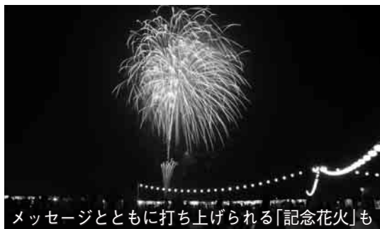
メッセージとともに打ち上げられる「記念花火」も

関宿まつり運営委員会では、関宿地域に伝わる郷土芸能をはじめ、ふるさとにより親しんでいただこうと、平成3年から「関宿まつり」を開催しています。