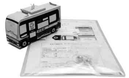
完成すると実車の38分の1サイズに