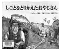
「しごとをとりかえたおやじさん」山越一夫・再話 福音館書店

興風図書館 ☎7123-7611 南図書館 ☎7125-7981 北図書館 ☎7129-8811 せきやど図書館 ☎7198-4946