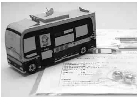
屋根の「枝豆」を引くと輪ゴムの力で自走

8月31日困まで、関宿城・北・新北・中・南・新南の6つのルートのまめバス車内に、ルート