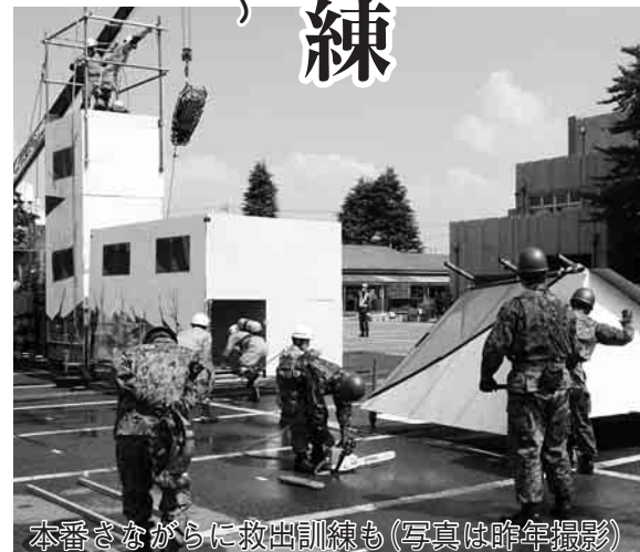
本番さながらに救出訓練も(写真は昨年撮影)

さらに、今年3月11日の東日本大震災は、国内観測史上最大のマグニチュード9.0を記録し、未曾有の大被害をもたらしました。震度5強を記録した野田市内でも、屋根瓦の落下やブロック塀