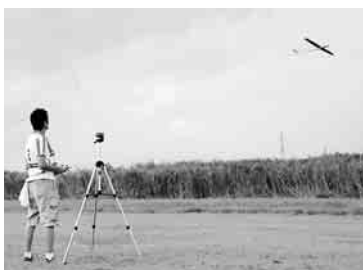
主翼の幅は約2メートル

電動グライダーの日本選手権が7月30日と31日、スポーツ公園で日本模型航空連盟により開催され、全国各地から20人の選手が参加した。時速200キロを超え空気を切り裂く音を立てて飛ぶ機体を操縦士が地上から自在に操り、20秒間の飛行距離や着陸の正確さなどを競い合った。 ※10月8日、9日には、同会場で開催大会も開催予定