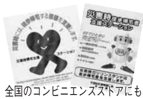
全国のコンビニエンスストアにも

ご協力をいただく店舗には、「災害時帰宅支援ステーション」のマークが掲示されていますので、万一の際の準備としてご確認ください。