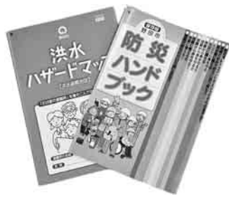
すぐに見られる場所に保管を

ご覧になり、避難場所や避難経路を再確認するなど、家庭での防災にお役立てください。