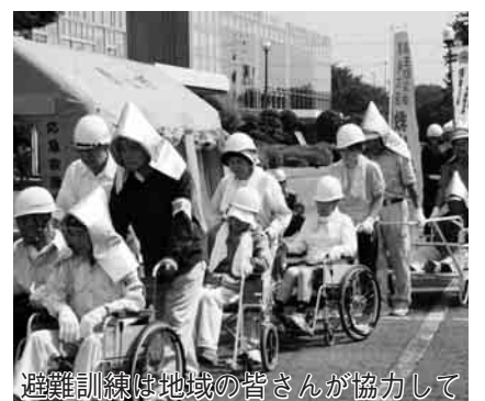
避難訓練は地域の皆さんが協力して