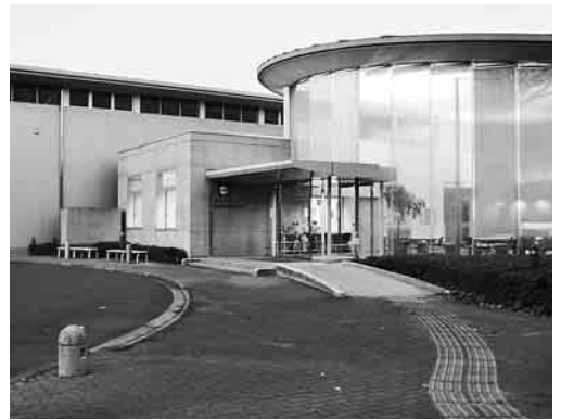
地域職業訓練の拠点として運営を継続

平成23年第1回定例市議会で、23年度の一般会計や6つの特別会計などの予算が可決されました。それぞれの予算は、一般会計が47億1千700万円、対前年度比で6パーセントの増、6つの特別会計が39億4千300万円、3・1パーセントの増、水道事業会計が41億2千619万3千円で3・6パーセントの増となり、全体で82億8千619万3千円、4・7パーセントの増となりました。