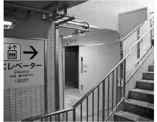
川間駅を高齢者や障がい者にも便利な駅に

この程、野田圏域も含めた未設置圏域における当該事業の受託希望団体の公募があり、野田圏域では、障害者自立支援法に基づき生活介護や共同生活介護、就労移行支援事業に積極的に取