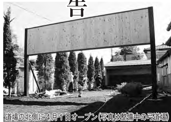
道場の北側に4月1日オープン(写真は整備中の弓道場)