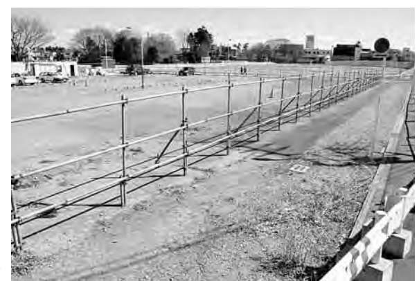
愛宕駅西口のイトーヨーカドー跡地

◆愛宕駅周辺地区の市街地整備 東地区の排水路(通称、大ドブ)は、本年度約30メートルのボックスカルバート敷設を3月中に完了