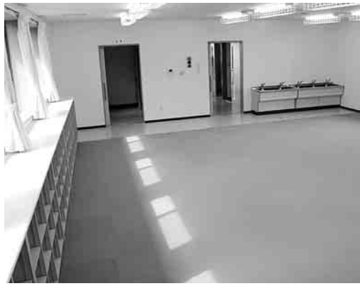
過密化解消に向けて(写真は宮崎第二学童)

達成されたため今議会に同条例の廃止条例案を提案しています。 ◆学童保育所の整備 4月開設予定の宮崎、みずき、南部の新設学童保育所は、1年生から3年生までの全児童を対象に保護者説明会を開催し、新設学童保育所の概要、入所手続と運営ルールを説明し、保護者からは、既存学童保育所との相違点、送迎時の駐車場所、建物の構造、設備などの質問などがありました。