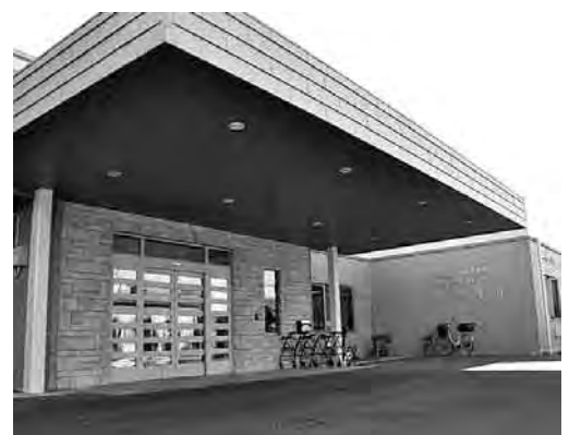
入所希望者の待機状態改善へ(写真は松葉園)

また、子宮頸がんワクチンの助成対象者は、小学5年生から中学3年生に相当する年齢の女性としていましたが、来年度からは、国の実施要領にあわせて、中学1年生から高校1年生に相当する年齢の女性と改めます。ただし、すでに市の助成を受け、接