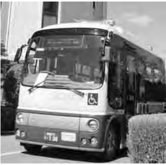
一日乗車券(200円)も利用できます

トの最終便と土・日・祝日の運行を取りやめる一方で、ご要望の多かった病院やスーパーなどを経由する新ルートで、4月1日から運行します。新しいルート図と時刻表は、3月15日号の市報と同時に全戸