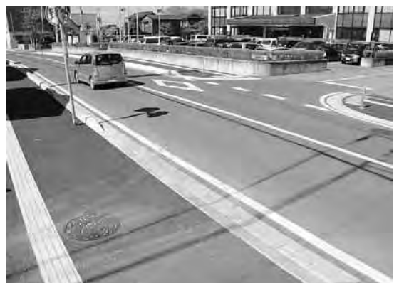
合併特例債でいちいのホール前も歩道を拡幅

また、乗り継ぎ券は廃止し、代わりに全ルート乗り放題の一日乗車券を大人200円、小学生と障がい者などは100円で販売します。次に、各ルートの主な変更点ですが、関宿城ルートは、やすらぎの郷に乗り入れるほか、観音前バス停を旧県道に変更します。北ルートは、平日26便のうち12便を野田病院に乗り入れ、堤台