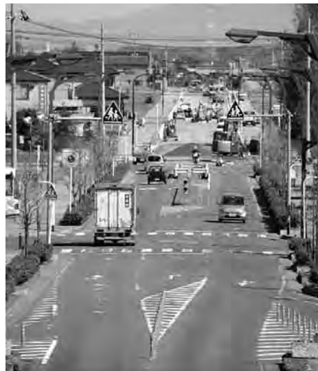
宝珠花橋から望む整備中の次木古布内線

位置付け事業化に向けた調整が続いてきましたが、今般県から来年度に大規模公共事業等事前評価を受けた後、詳細設計を実施し、24年度から用地買収をスタートさせたいと説明がありました。