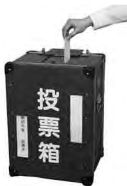
投票状況はホームページでも

【問合せ】環境基本計画は環境保全課、子育て支援・児童虐待防止総合対策大綱は児童家庭課