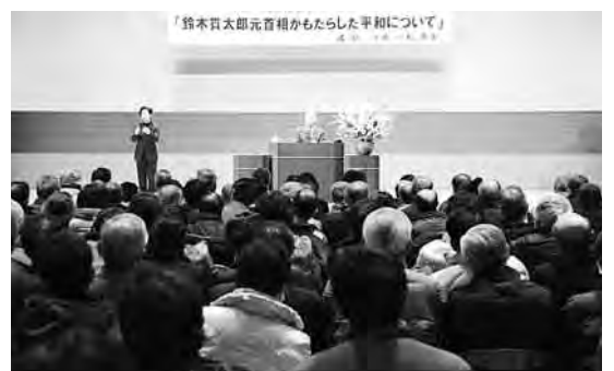
半藤氏の講演では鈴木貫太郎翁の功績が語られた

また、もう1つの市実施の冠事業である「NHKのど自慢」は、ゲストに北島三郎さん、都はるみさんを迎え、1月30日に文化会館で実施され、250組の予選を勝ち抜いた20組が得意の歌を披露する姿や、熱気あふれる会場の様子が12時15分から13時まで全国に