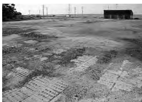
新不燃物処理施設建設予定地(目吹地先)

契約締結議案を提案しています。議決を頂き、都市計画決定などの手続を進め、来年度早々から実施設計に入りたい考えです。