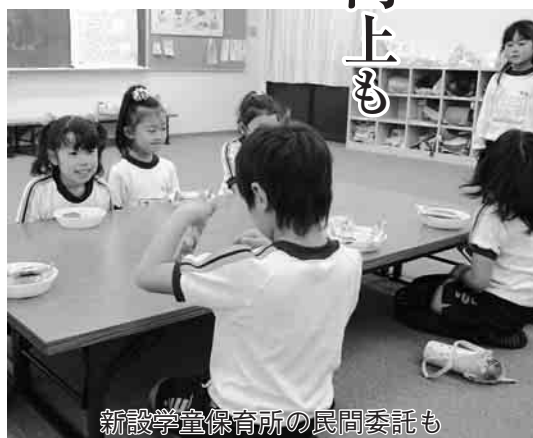
新設学童保育所の民間委託も

限られた財源の中で、市民ニーズに合ったサービスを向上させようと、市では「行政改革大綱」と「集中改革プラン」を策定し、計画2年目の平成22年度は、指定管理者制度の導入や職員削減などに取り組んだ結果、約8・2億円の経費を削減することができました。さらに、「パブリック・コメント手続条例」制定や審議会委員の公募などで市民参加を進めるとともに、市民課窓口の日曜開設や時間延長など市民のニーズに合った行政運営やサービスの提供に努めました。