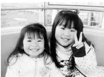
あみなちゃん・みななかちゃん (20.10.17生・左) (16.11.12生・右)