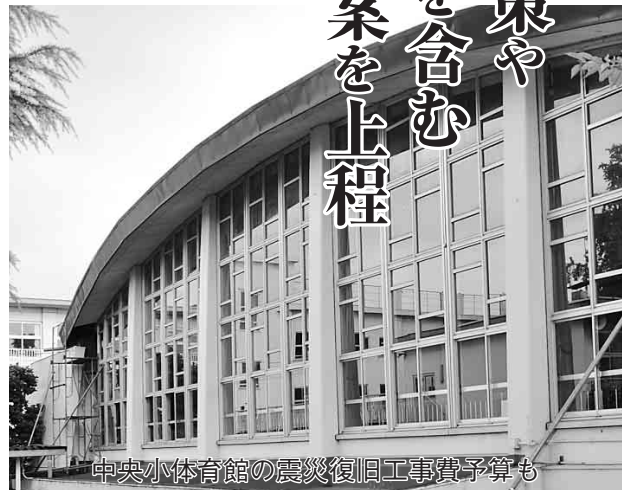
中央小体育館の震災復旧工事費予算案

平成23年第4回定例市議会は、8月31日から9月26日までの会期で開催されています。今議会では、中心市街地の商業活性化や当面の弱い物弱者対策、さらに、中央小学校体育館の復旧工事や東日本大震災見舞金、被災者住宅再建資金利子補給金などの震災関連費用を含む補正予算案など、13議案を上程し審議されています。