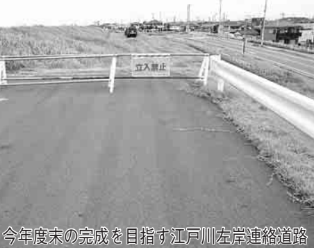
今年度末の完成を目指す江戸川左岸連絡道路