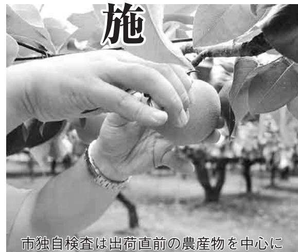
市独自検査は出荷直前の農産物を中心に

8月末現在、6品目32検体を検査し、ブルーベリー5検体中1検体から国の暫定規制値1キログラムあたり500ベクレルを大きく下回る22ベクレルの放射性セシウムを検出しましたが、その他の5品目からは放射性物質は検出されませんでした。 なお、市のホームページでは測定結果を市域を北部(旧関宿町・旧二川村・旧木間ヶ瀬村)、中部(旧川間村・旧七福村・旧旭村)、