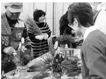
季節の花を添えて彩りと香りも

約20人が参加し、空き缶を芯に利用した高さ30センチほどの門松を作成。2年連続で参加したという一人は、「昨年よりきれいに仕上がりました」と満足そうに笑っていた。