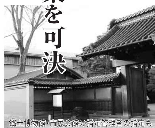
郷土博物館・市民会館の指定管理者の指定も

所の指定管理者の指定／野田市郷土博物館及び野田市市民会館の指定管理者の指定／野田市立南図書館、野田市立北図書館、野田市南コミュニティ会館及び野田市北コミュニティ会館の指定管理者の指定／野田市関宿総合公園及び野田市営関宿少年野球場の指定管理者の指定／野田市道路線の認定／野田市道路線の廃止／平成23年度野田市一般会計補正予算(第6号)／平成23年度野田市民健康保険特別会計補正予算(第2号)／平成23年度野田下水道事業特別会計補正予算(第2号)／平成23年度野田用地取得特別会計補正予算(第2号)／平成23年度野田市介護保険特別会計補正予算(第2号)／平成23年度野田市次木親野井特定土地区画整理事業特別会計補正予算(第1号)／平成23年度野田市後期高齢者医療特別会計補正予算(第2号)