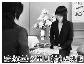
清水(左)が里見(右)に挑戦する「ユニバーサル杯第38期女流名人位戦五番勝負第2局」を開催します。

市では、1月22日(日)13時から17時(予定)まで、いちいのホール5階の関根名人記念館対局室を会場に、里見香奈女流名人と挑戦者の清水市代女流六段による「ユニバーサル杯第38期女流名人位戦五番勝負第2局」を開催します。