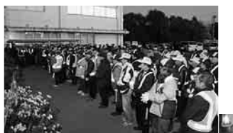
約200人が参加した木間ヶ瀬支部(上)と巡回を行う中央東支部

手作りのミニ門松で 新しい年のお迎えを みどりのふるさとづくり実行委員会では、12月23日、江川地区の野田自然共生ファーム施設内でミニ門松づくりの講習会を行った。