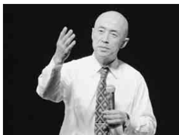
テレビ撮影時の裏話も交えて

話す人間関係の体験談には会場から笑い声も。最後は、「夫婦円満の秘訣はちょうどよい距離感を見つめること。そのためにはお互い一生自分を磨く努力が必要」と締めくくった。