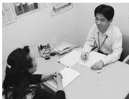
一人ひとりに合わせた相談を実施

市では、平成19年に策定した「野田市障害者基本計画（第二次改訂版）」に基づき、「障がい者総合相談・就労支援センター」による相談支援体制の強化や、福祉のまちづくりパトロールによるバリアフリー化の推進などに取り組んできました。 また、障がい者や関係団体の皆さんの要望にお応えし、傷害保険料や交通費の助成、重度心身障がい者の医療費助成上乘せな