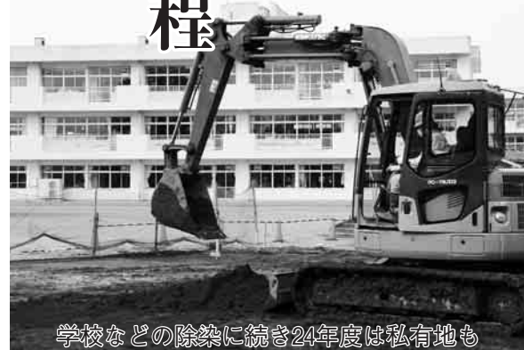
学校などの除染に続き24年度は私有地も

【応募方法と問合せ】清掃計画課や各公民館などで配布する申込書に必要書類を添えて直接か郵送で〒278-8550野田市役所清掃計画課へ