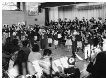
演奏に合わせて小学生のダンスも

ケ瀬小で開催された。今年で11回目の演奏会は、園児による元気な合唱に始まり、最後には小・中・高校生による息の合った合同演奏も披露され、集まった約800人の観客を楽しませた。